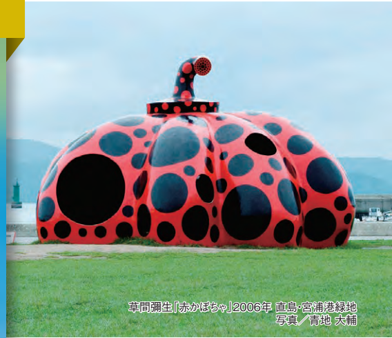
草間彌生「赤いぼちゃん」2006年 直島・宮浦港緑地