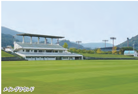
メイングラウンド